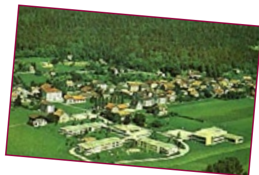
Dombresson, avec les bâtiments de la Fondation Borel au premier plan

Ces outils modernes permettent encore les échanges d'expériences avec d'autres collègues: transmission de documents spéciaux, de petits logiciels ou de «tuyaux». Nous sommes un peu moins seuls dans notre classe. D'ailleurs, certain-es enseignant-es de classe de préapprentissage se sont créé leur propre banque de données. Cela constitue une mine d'informations précieuses pour les élèves qui y ont accès.